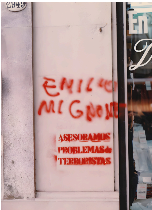
Fotografía del frente del edificio donde vivía la familia Mignone.

Se les mandó a todos los obispos de la Argentina un ejemplar a cada uno. Tampoco nos pasó. Pero lo de Martínez fue el detonante [...] mientras circuló acá, bueno, pero todo lo que pudieras pegarle a nivel internacional era mucho más grave para ellos. Eso está dibujado en el expediente, pero viste que el expediente empieza como todo lo que hacen los servicios: se recibió, se supo que... bueno, 'se supo' era Martínez. 256